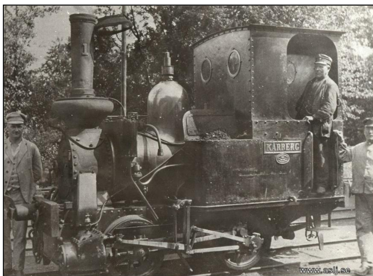
Lok SB 1 - "Kårberg". Framför loket vaktmästare Johan Wahlin, i hytten lokförare Hagelin (endast 1,62 m lång).

Ansträngningar i detta hänseende brukar gå ut över de estetiska värdena, men "KÅRBERG" blev en fullträff, i vilket man lyckades förena enklast tänkbara tekniska utförande med konventionella begrepp om hur ett lok ska se ut.