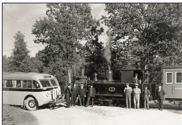
Möte mellan buss och SB5 i Skyllberg.

Persontrafiken överfördes senare till landsväg, till det nybildade dotterbolaget Skyllbergs Omnibuss AB.