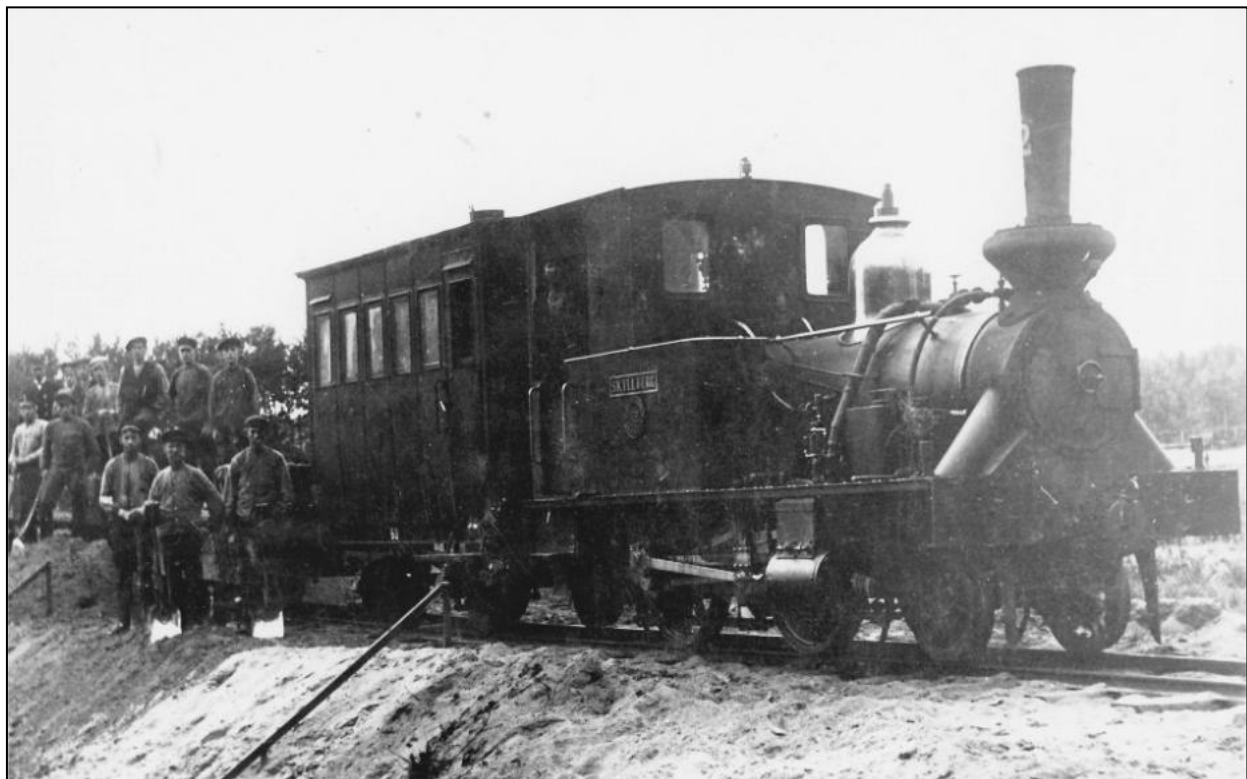
SB2 1 Skyllberg + "Orrakojan"

Att lägga märke till är att p.g.a. alla ovan nämnda bråk under byggtiden, så deltog ingen från Skyllbergs Bruks AB:s ledning i invigningsceremonin. En tydlig missnöjesmarkering! En annan sådan är att man under årens lopp t.ex. undvek att hylla Askersund med några lok-namn ! Istället döptes loken till "KÅRBERG", "SKYLLBERG", "LERBÄCK" och "SKYLLBERGS BRUK". Men alltså inte "ASKERSUND" !